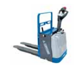
MAJESTIC AC-evo Kg 1600 - 2000 mm 200