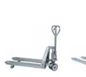
CARRELLI ELEVATORI, TRANSPALLET E TAVOLE ELEVATRICI STANDARD E SPECIALI IN ACCIAIO INOSSIDABILE STAINLESS STEEL PRODUCTION (Stackers, Pallet Trucks and Lift Tables)