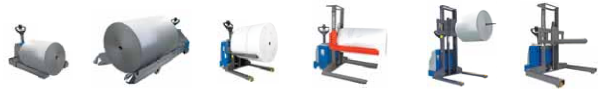
■ Forche Sagomate / Spuntone orizzontale Cradle Forks / Horizontal Probes