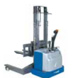
4 VIE AC-evo Kg 1200 - 1500 mm 1600 - 2500 - 3000 - 3500