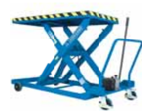
TM Kg 500 - 1000 Manuale / Manual