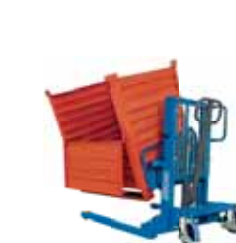
ALFA MRL evo RIBALTATORE LATERALE SIDE FILTER