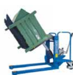
ALFA MRF evo RIBALTATORE FRONTALE FRONT FILTER