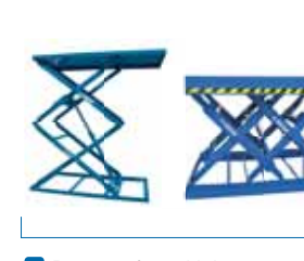
Pantografo multiplo Double scissors