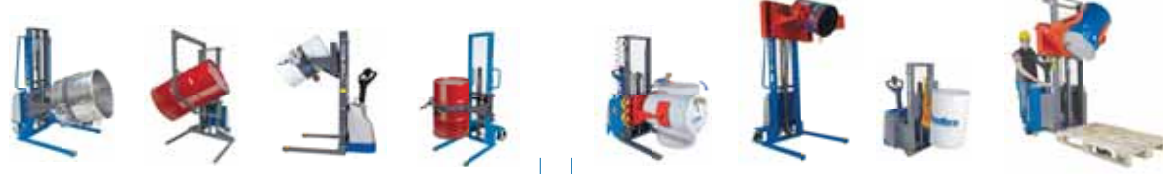
■ Anello girafusti frontale / laterale Front & Side ring clamp drum turners