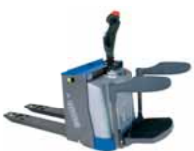
CHALLENGER AC-evo Kg 1500 - 2000 mm 200