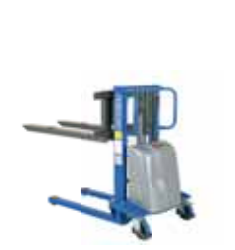
ALFA SMALL 12V evo / ALFA 12V evo Kg 500 / 1000 mm 800 - 1600 / 2500 - 3000 - 3500