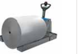
DISCOVERY PB AC-evo Kg A richiesta / Per requirements mm A richiesta / Per requirements