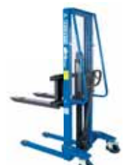
BETA M evo Kg 1000 - 1200 mm 800 - 1600