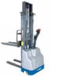
MASTER LIGHT / PLUS evo Kg 1000 / 1200 mm 2900 - 3300 / 2500 - 3000 - 3500