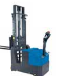
DELTA CP AC-evo Kg 600 - 800 - 1000 - 1200 - 1500 mm 1600 - 2500 - 3000 - 3500