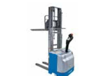
MAX AC-evo Kg 1300 - 1600 - 2000 mm 1600 - 2500 - 3000 - 3500