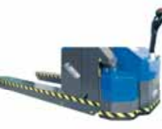
TPE HL AC-evo Kg Da 5000 a 20000 mm A richiesta / Per requirements