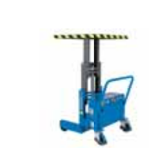
GAMMA 800 12V Kg 800 Elettrico / Electric 12V