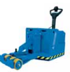
TPT HL AC-evo Kg Da 7000 a 20000 mm A richiesta / Per requirements