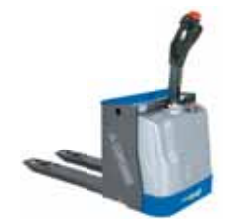
DISCOVERY AC-evo Kg 2000 - 2500 - 3000 - 3500 - 4000 mm 200