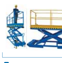
Sollevamento operatore Lift Table for operator lifting