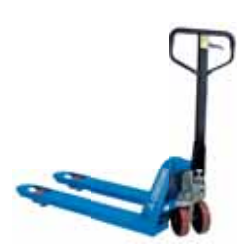
TPM Kg 2000 - 2500 - 3000 mm 200

The evoLINE of Armanni Carrelli Elevatori is the result of more than 35 years of work and experience into the material handling field, characterized by the innovative DR EVO drive steering and by the application of the AC three-phase technology traction motors. Besides the wide range of standard stackers, pallet trucks and lift tables, customized solutions are possible.