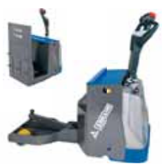
TPT / TPT UB AC-evo Kg 4000 - 5000 - 6000 mm A richiesta / Per requirements