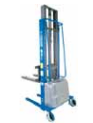
BETA 12V evo Kg 1000 - 1200 - 1500 mm 800 - 1600 - 2500 - 3000 - 3500