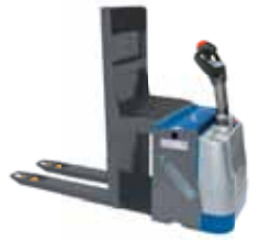
SKIPPER AC-evo Kg 1500 - 2000 - 2500 - 3000 mm 200 / 200 - 850