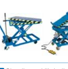
Pianali ruotabili, inclinabili, scorrevoli, su misura Custom lift tables with shifting, rotating and sliding tops