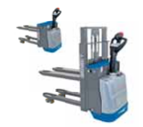
SMART DL AC-evo Kg 1800/750 - 1800/1050 mm 200/700 - 200/1400