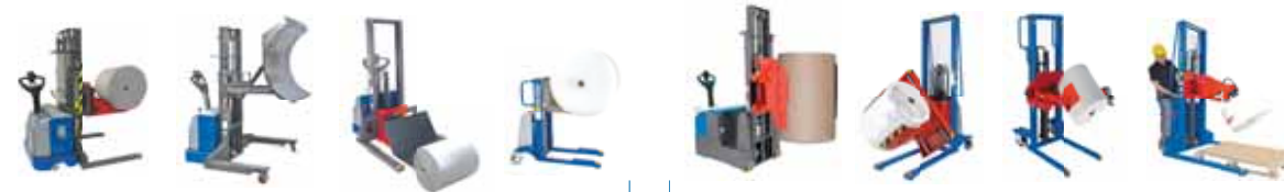
■ Culla Porta - Bobine Fissa o Ribaltabile Fixed or Tilting cradle