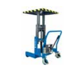
GAMMA 800 M Kg 800 Manuale / Manual