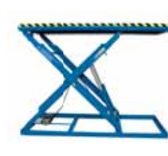
TE Kg 500 - 1000 - 1500 - 2000 - 2500 Elettrico / Electric 220 o 380V