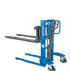
ALFA M evo Kg 250 - 500 - 1000 mm 800 - 1600