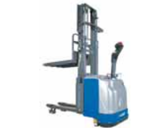
DELTA TP AC-evo Kg 1200 - 1500 mm 1600 - 2500 - 3000 - 3500