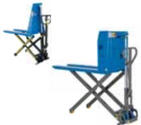
TPM GAL 10 / TPM GAL 10 12V Kg 1000 mm 800