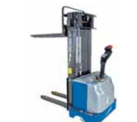
DELTA TRX / TRXFL AC-evo Kg 1400 mm 3500 - 4000 - 4500