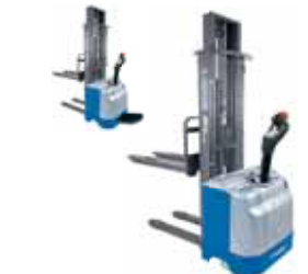
DELTA / E / UB AC-evo Kg 1200 - 1500 mm 1600 - 2500 - 3000 - 3500