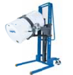
ALFA MGF evo GIRAFUSTI FRONTALE DRUM TIPPER