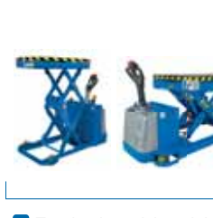
Tavole elevatrici traslabili Lift tables on electronic truck