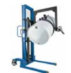
ALFA MGL evo GIRAFUSTI LATERALE SIDE DRUM TIPPER