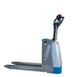
SMART LIGHT evo / PLUS AC-evo Kg 1500 / 2000 mm 200