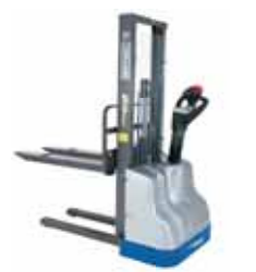
SPEEDY LIGHT / PLUS evo Kg 1000 / 1200 mm 1600