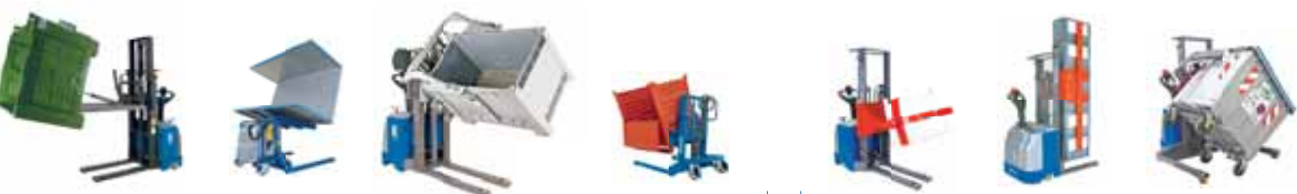
■ Ribalta cassoni frontali e laterali Front & Side tilters

MOVIMENTAZIONE CONTENITORI INDUSTRIALI INDUSTRIAL CONTAINER HANDLING