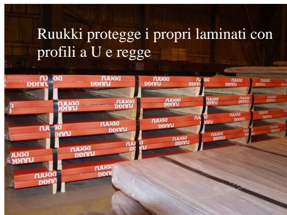
Ruukki protegge i propri laminati con profili a U e regge