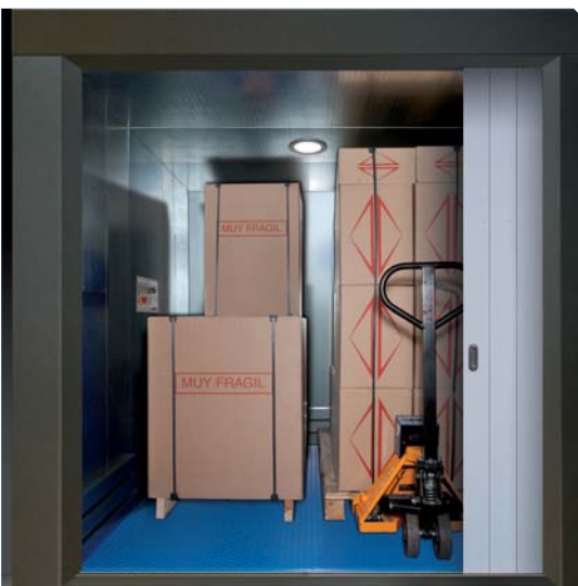
Modo piattaforma merci. Si può fare miglior uso della superficie utile di carico e si aziona l'elevatore dalle bottoniere di piano; sarà necessaria pertanto la presenza di un operatore ad ogni piano di carico o che lo stesso si muova tra un piano e l'altro.